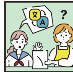
日本語が第一言語でない家族や障がいのある家族のために通訳をしている。