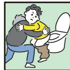
障がいや病気のある家族の入浴やトイレの介助をしている。

ヤングケアラーの支援については 市区町村の「こども家庭センター」 又は児童福祉担当部署までご連絡ください