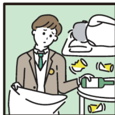
アルコール・薬物・ギャンブル問題を抱える家族に対応している。