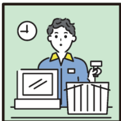
家計を支えるために労働をして、障がいや病気のある家族を助けている。