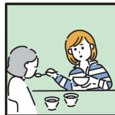
障がいや病気のある家族の身の回りの世話をしている。