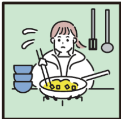
障がいや病気のある家族に代わり、買い物・料理・掃除・洗濯などの家事をしている。

ヤングケアラーを支援につなぐにあたっては、本人の意思を尊重すること、本人や家族の想いを第一に考えることが重要です。本人や家族との対話の中で緊急性を確認した上で、信頼関係を築きながら状況の把握をお願いします。