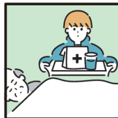
がん・難病・精神疾患など慢性的な病気の家族の看病をしている。