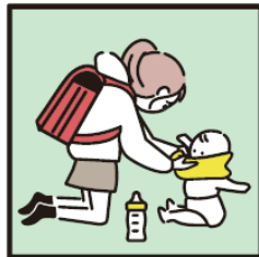
家族に代わり、幼いきょうだいの世話をしている。