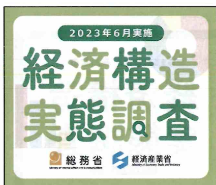
300 × 250 px