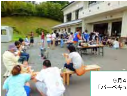
9月4日(日) 「バーベキューde懇親会」